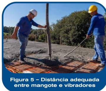
Figura 5 – Distância adequada entre mangote e vibradores

Durante a execução da concretagem, é essencial evitar qualquer interrupção no processo de bombeamento, assegurando a homogeneidade do concreto e a continuidade do lançamento, fatores indispensáveis para o bom desempenho da estrutura. Deve-se manter distância adequada entre o mangote do caminhão-bomba e os vibradores de imersão ( Figura 5 ), a fim de evitar interferências mecânicas no adensamento e garantir a eficiência do processo, conforme as práticas recomendadas de execução. Adicionalmente, é terminantemente proibido lançar concreto diretamente sobre armaduras que contenham cabos energizados, por se tratar de uma situação de risco crítico à segurança dos trabalhadores e à integridade da estrutura, devendo esse cuidado ser rigorosamente observado pela equipe de obra.