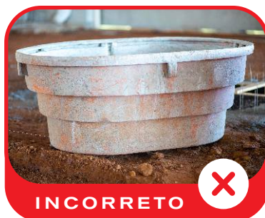
Figura 9 - Caixa suja.