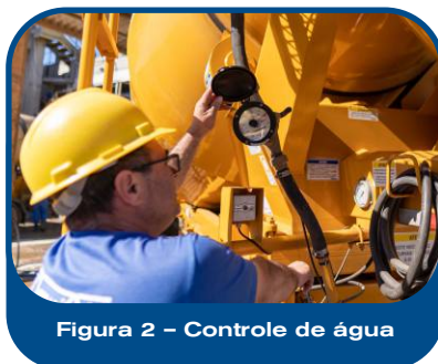
Figura 2 – Controle de água

tiver sua composição alterada, sendo de responsabilidade exclusiva do contratante a rastreabilidade dos concretos aplicados.