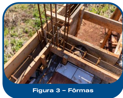
Figura 3 – Fôrmas

As fôrmas destinadas ao recebimento do concreto devem estar corretamente dimensionadas, montadas e travadas, em conformidade com os critérios estabelecidos pela ABNT NBR 14931, de modo a garantir estabilidade, estanqueidade e segurança estrutural durante o lançamento do concreto ( Figuras 3 e 4 ). Além disso, é essencial que sejam previamente molhadas antes do início da concretagem, especialmente nos elementos verticais, como pilares, os quais exigem molhagem adequada. Essa medida tem por objetivo evitar a absorção excessiva de água pela fôrma, o que poderia comprometer a hidratação do cimento e, por consequência, a resistência final e o desempenho do concreto. Tais cuidados seguem as boas práticas recomendadas pelas normas técnicas vigentes e devem ser observados rigorosamente pela equipe de obra.