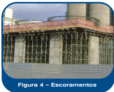
Figura 4 – Escoramentos