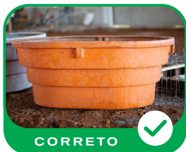
Figura 8 - Caixa Limpa.

Para as entregas em caixas, é responsabilidade do contratante garantir que as mesmas estejam devidamente limpas, livres de resíduos e posicionadas em local de fácil acesso, de forma a permitir a descarga eficiente e segura da argamassa ( Figuras 8 e 9 ).