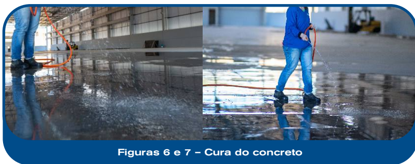
Figuras 6 e 7 – Cura do concreto

A cura do concreto ( Figuras 6 e 7 ) deve ser iniciada imediatamente após o lançamento e o adensamento, com o objetivo de preservar a umidade necessária à hidratação do cimento e promover o desenvolvimento adequado das propriedades mecânicas do material. A manutenção da cura úmida deve ser garantida por um período mínimo de 5 dias, conforme recomendam as boas práticas da engenharia e as normas técnicas aplicáveis. Em condições climáticas adversas, como altas temperaturas, baixa umidade relativa do ar ou ventos intensos, é imprescindível adotar medidas adicionais de proteção, a fim de evitar a evaporação prematura da água de amassamento e a conseqüente formação de fissuras por retração plástica, fatores que podem comprometer a durabilidade e o desempenho da estrutura ao longo do tempo.