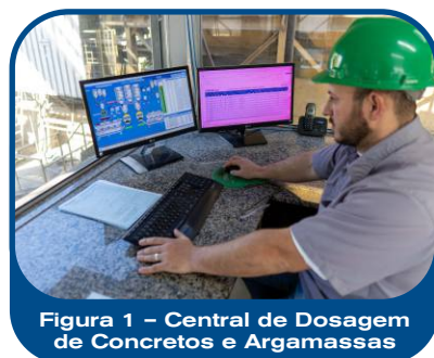
Figura 1 – Central de Dosagem de Concretos e Argamassas

Ao delimitar de forma objetiva essas atribuições, a CERAÇÁ reforça seu compromisso com a transparência, a segurança operacional e a eficácia técnica nas relações com seus clientes, garantindo que cada etapa da obra seja executada com clareza de responsabilidades e foco no desempenho final da estrutura.